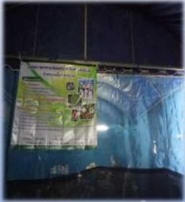
งานต่างๆในชุมชน