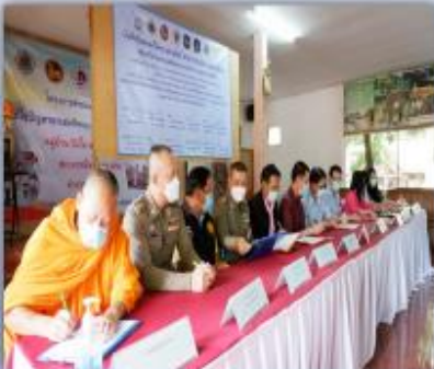
ร่วมลงนามบันทึกข้อตกลงร่วมกัน