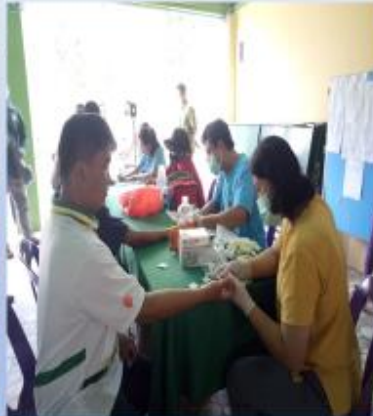
การตรวจสอบสารเคมีตกค้าง