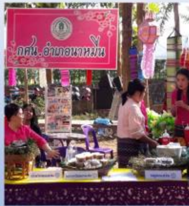
แปรรูปอาหารในชุมชน