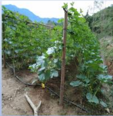
โครงการหลวง