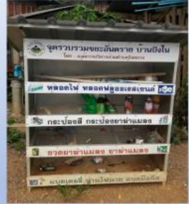
รณรงค์คัดแยกขยะในครัวเรือน