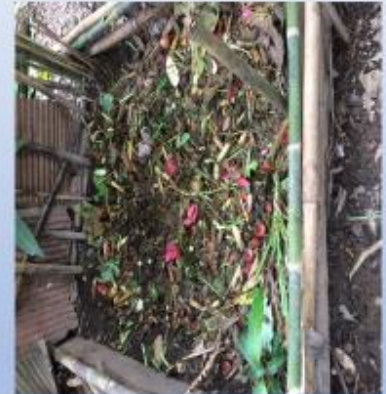
การกำจัดขยะในครัวเรือน