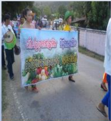
รณรงค์ใช้มาตรการอาหารปลอดภัย