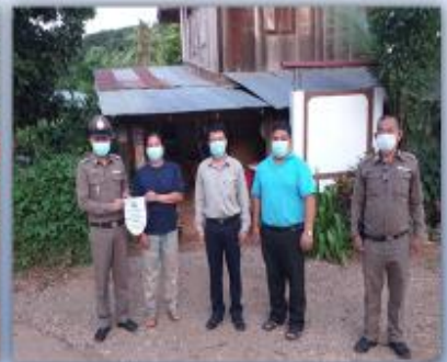
การรับรองครัวเรือนที่ปลอดภัยเสพติด