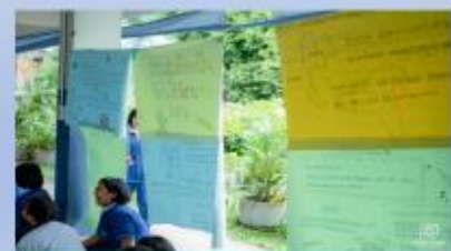
จัดกิจกรรมต่อต้านยาเสพติด