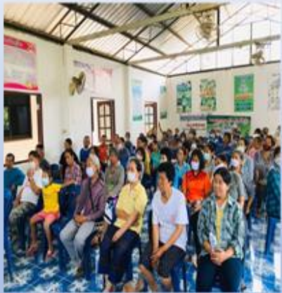
ให้ความรู้ในชุมชน