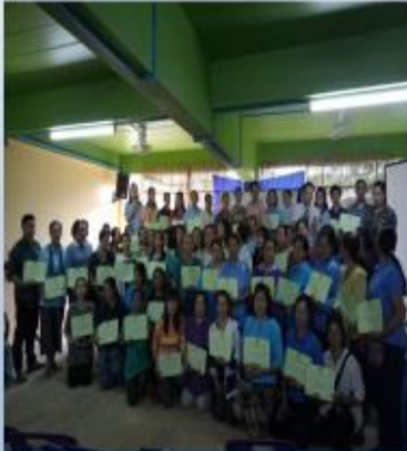
มีสารวัตรอาหารหมู่บ้าน