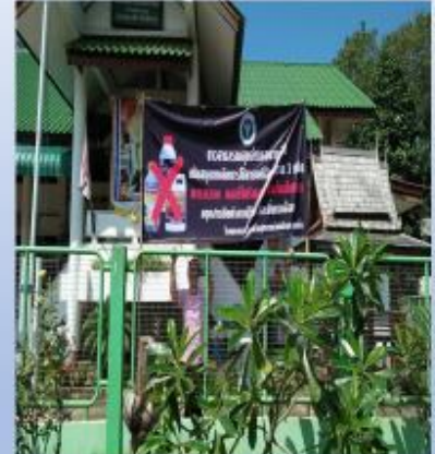
รณรงค์การใช้สารเคมี