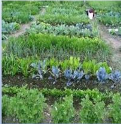
ณรงค์ปลูกผักปลอดสารพิษ