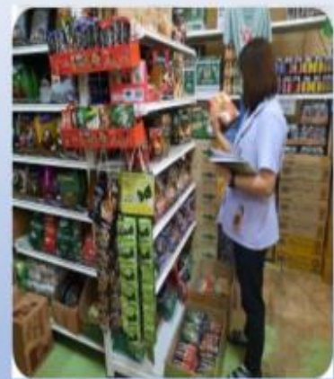
ตรวจสอบผลิตภัณฑ์อาหาร