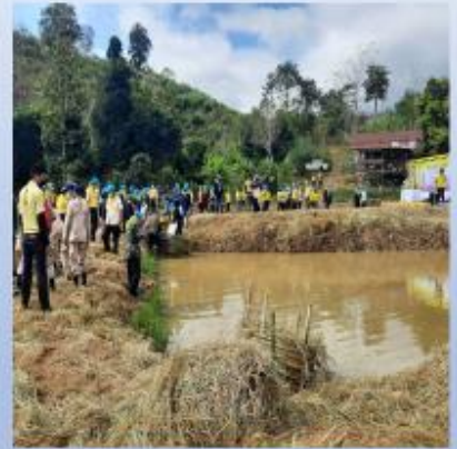
โคกหนองนา โมเดล