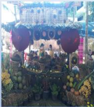
มหกรรมอาหารปลอดภัย