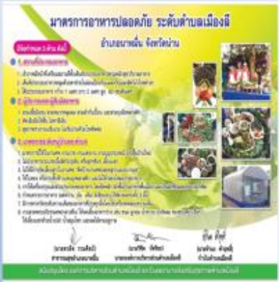
กำหนดมาตรการอาหารปลอดภัย