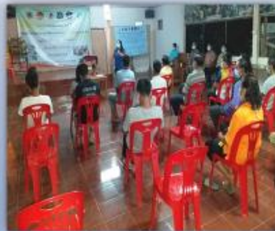
กิจกรรมบำบัดโดยชุมชนมีส่วนร่วม