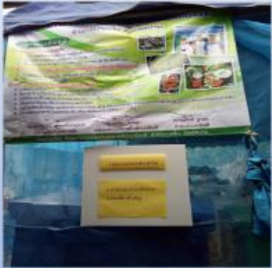
รณรงค์ใช้มาตรการอาหารปลอดภัยในงานชุมชน