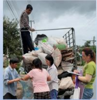
การกำจัดขยะโดยท้องถิ่น / ชุมชน